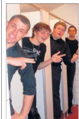
Die Flexxi Tones feiern mit bei der Live-Nikolausparty im Irish Pub.

sa 5. dezember Wooloomooloo Bay Hotel (CO): Tanz im Pool mit DJ Heinz Loom (CO): Red Loom Sonderbar (CO): Schwof mit DJ Blue Eye Bocadito (CO): Nachtwerk G1 Tanzbar (CO): Nikolausi Party Irish Pub (CO): Große Live-Nikolausparty mit The Flexxi Tones Brünlla (Rothenkirchen): Hütten Opening mit DJ Papaoke