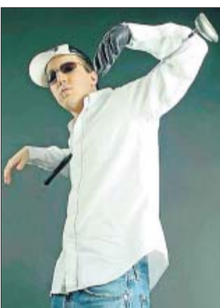
Live im „Hirsch“: Prinz Pi.

Ausgerüstet mit Texten voll von Metaphern und seiner Wut als nie leer werdendes Magazin, tritt er an, den Beweis zu liefern, dass es besser geht als das, was der Rest vorgibt. Live stellt er sich am Donnerstag, 3. Dezember, dem Publikum im Nürnberger „Hirsch“. Beginn: 19 Uhr.